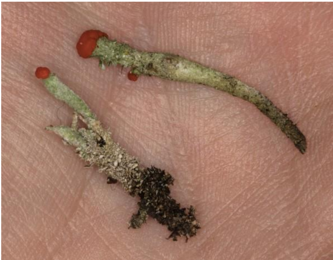
links de dove en rechts de rode heidelucifer