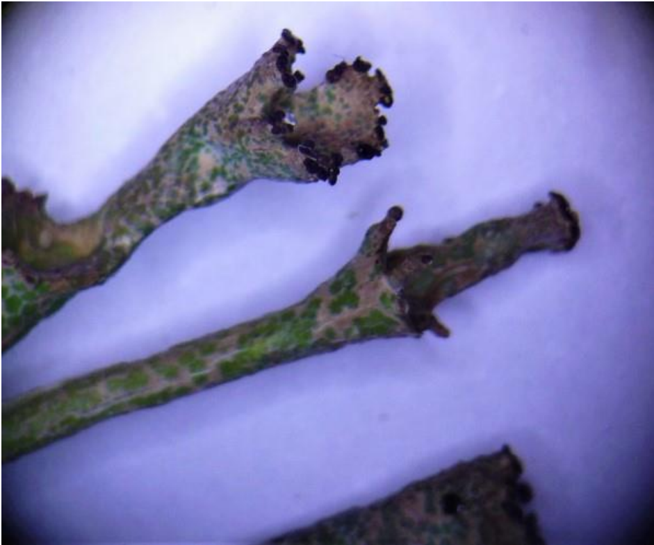
Dit zijn girafjes