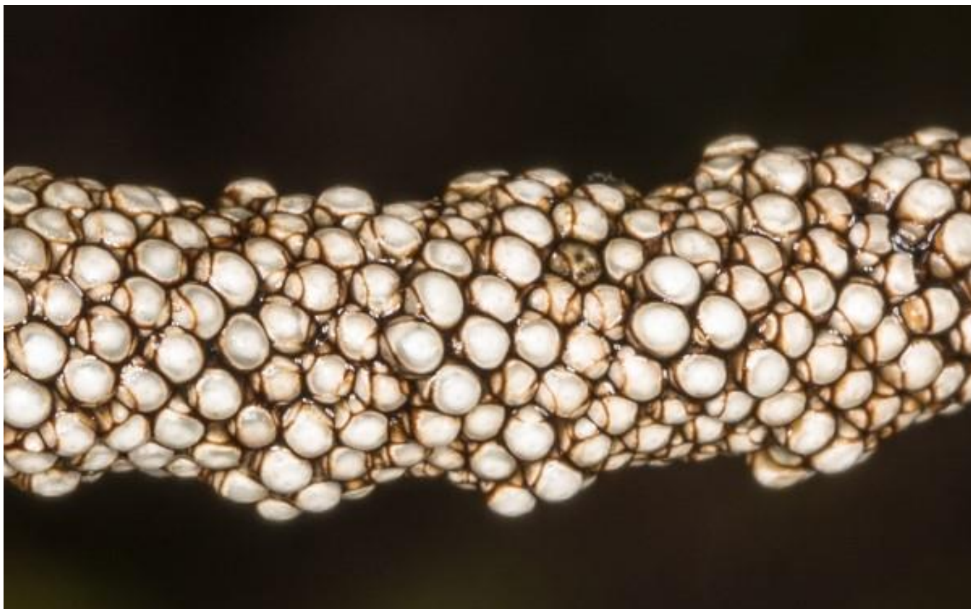
eitjes van de heideringelrups